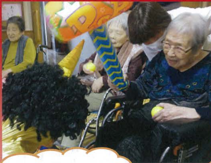
鬼の施設長も がんばりました。