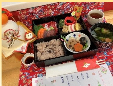
なんと入居者様が盛り付けて下さいました♪