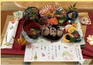
俵結びにした赤飯がおいしそうです！！