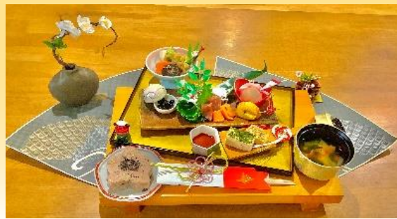
★折り紙を扇に見立てたアイデアが秀逸★